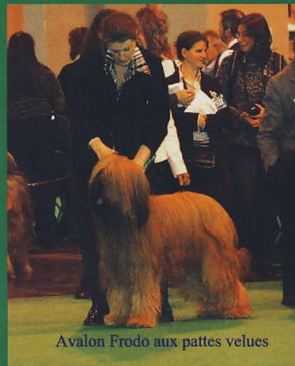
Avalon Frodo aux pattes velues